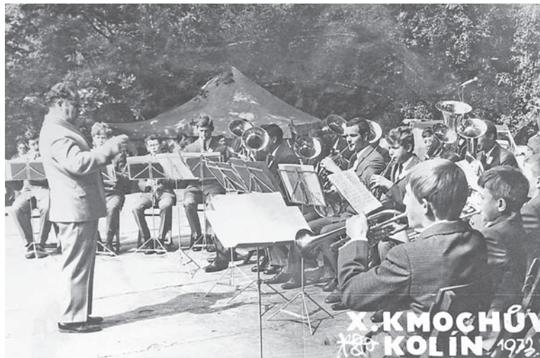
Международный фестиваль духовых оркестров в Чехословакии. 1972 г.